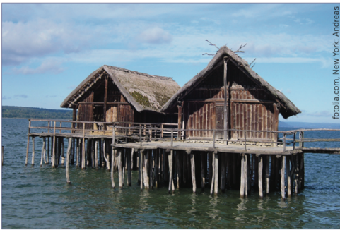
A Beispiel für Welterbe: Prähistorische Pfahlbauten um die Alpen (Foto: Rekonstruktion)