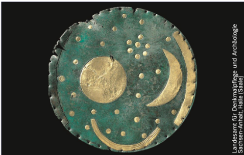
D Beispiel für Weltokumentenerbe: Himmelscheibe von Nebra