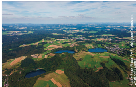
C Beispiel für einen Geopark: Vulkaneifel