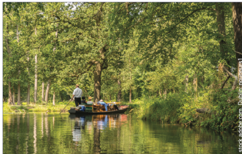
E Beispiel für ein Biosphärenreservat: Spreewald