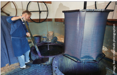
B Beispiel für immaterielles Kulturerbe: Blaudruck